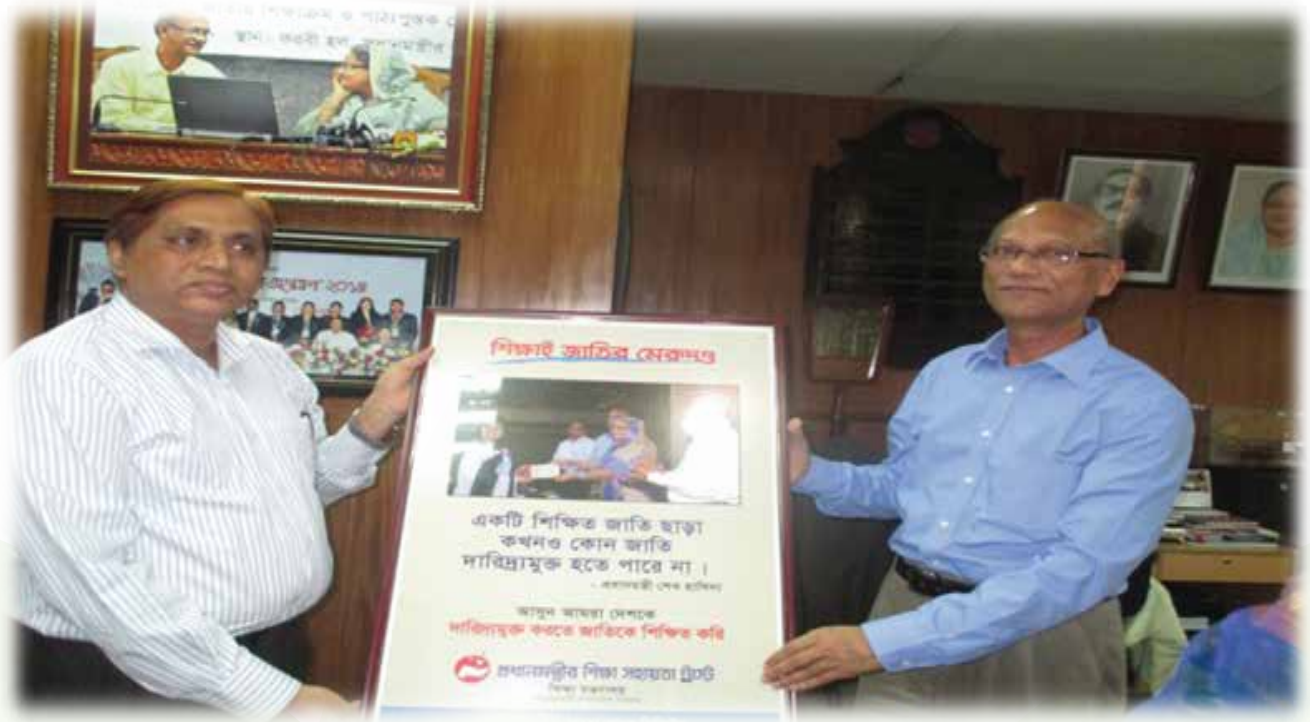
[নারী শিক্ষার প্রসার, বাল্যবিবাহ রোধ ও মাননীয় প্রধানমন্ত্রীর বাণীসম্বলিত প্রকাশিত পোস্টার মাননীয় শিক্ষামন্ত্রীর হাতে তুলে দিচ্ছেন প্রধানমন্ত্রীর শিক্ষা সহায়তা ট্রাস্ট এর ব্যবস্থাপনা পরিচালক]

২০১৩-২০১৪ অর্থবছর থেকে ২০১৭-২০১৮ অর্থবছর পর্যন্ত নারী শিক্ষার প্রসার, বাল্যবিবাহ রোধ তথা নারীর ক্ষমতায়ন, শিক্ষাবিষয়ক এবং মাননীয় প্রধানমন্ত্রী শেখ হাসিনার বাণীসম্বলিত মোট সত্তর হাজার পোস্টার ছাপানো হয়েছে। উক্ত পোস্টারসমূহ প্রধানমন্ত্রীর কার্যালয় ও শিক্ষা মন্ত্রণালয়সহ সারা দেশের সংশ্লিষ্ট অফিস ও শিক্ষা প্রতিষ্ঠানসমূহে বিতরণ করা হয়েছে।