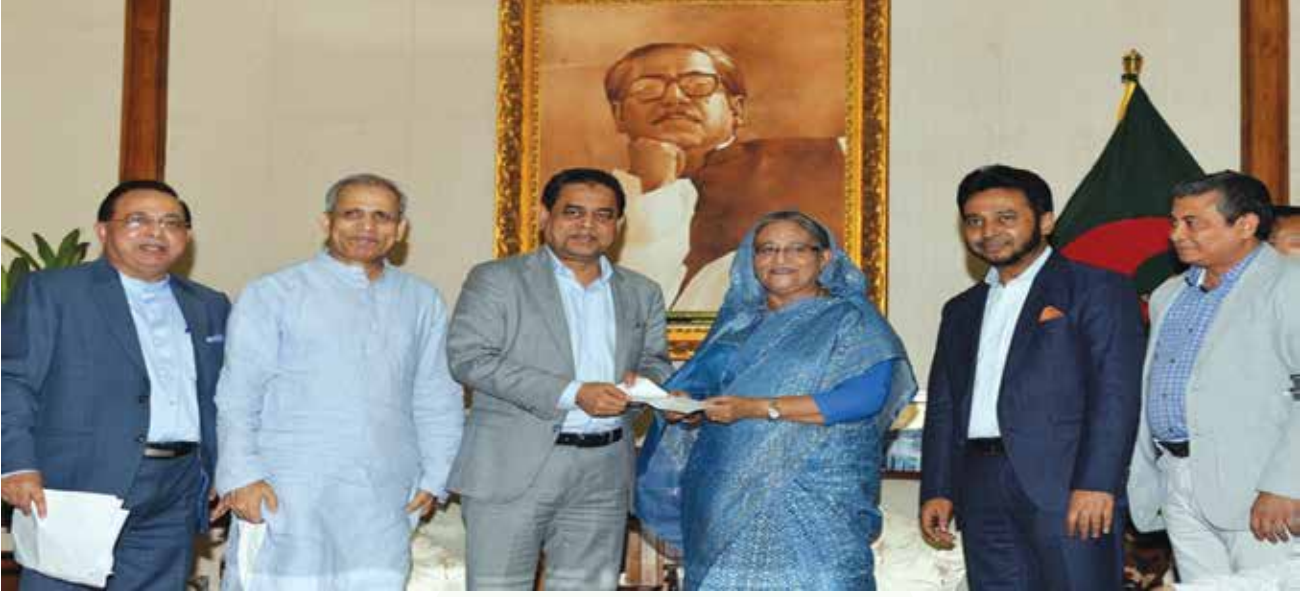
[প্রধানমন্ত্রীর শিক্ষা সহায়তা ট্রাস্ট তহবিলের জন্য ১৫ মে, ২০১৭ খ্রিস্টাব্দে গণভবনে ব্যবসায়ীগণ মাননীয় প্রধানমন্ত্রী শেখ হাসিনার নিকট অনুদানের চেক হস্তান্তর করেন।]