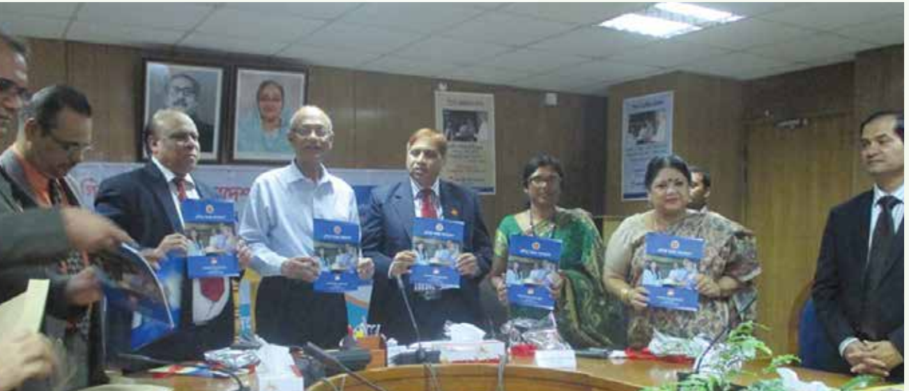
[প্রধানমন্ত্রীর শিক্ষা সহায়তা ট্রাস্ট এর উদ্যোগে প্রকাশিত ‘এগিয়ে যাচ্ছে বাংলাদেশ’ এর প্রকাশনা উৎসব শিক্ষা মন্ত্রণালয় এর সম্মেলন কক্ষে অনুষ্ঠিত হয়]