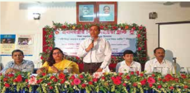
[‘নারী শিক্ষা অব্যাহত ও নারীকে আত্মপ্রত্যয়ী করে তোলার বিষয়ে করণীয়’ শীর্ষক কর্মশালা ফরিদপুর জেলা প্রশাসক এর সম্মেলন কক্ষে অনুষ্ঠিত হয়]

বাংলাদেশের মোট জনসংখ্যার প্রায় ৫০ শতাংশ নারী। নারীর সক্রিয় পদচারণায় মুখর কৃষি, শিক্ষা, সংস্কৃতি, ক্রীড়া, রাজনীতি, ব্যবসাসহ সব পেশা। সাম্প্রতিক বাংলাদেশের অগ্রগতিতে নারীর রয়েছে অত্যন্ত গুরুত্বপূর্ণ অবদান। পরিবার, সমাজ ও রাষ্ট্রের উন্নয়নে নারীর অবদান আরো সক্রিয় ও অংশগ্রহণমূলক করার লক্ষ্যে প্রধানমন্ত্রীর শিক্ষা সহায়তা ট্রাস্ট এর অর্থায়নে ‘নারী শিক্ষা অব্যাহত ও নারীকে আত্মপ্রত্যয়ী করে তোলার বিষয়ে করণীয়’ শীর্ষক কর্মশালা জেলা পর্যায়ে আয়োজন করা হয়েছে। প্রধানমন্ত্রীর শিক্ষা সহায়তা ট্রাস্ট এর অর্থায়নে এ কর্মশালা জেলা প্রশাসন ও জেলা শিক্ষা অফিস এর সহযোগিতায় অনুষ্ঠিত হয়েছে। প্রত্যেকটি কর্মশালায় ০৩ (তিন) জন গবেষক তাঁদের গবেষণা প্রবন্ধ উপস্থাপন করেছেন। উক্ত কর্মশালায় বিভিন্ন শিক্ষা প্রতিষ্ঠান থেকে আগত শিক্ষা প্রতিষ্ঠান প্রধানগণ, প্রশাসনের কর্মকর্তাগণ, স্থানীয় সংবাদকর্মী, এন.জি.ও কর্মকর্তা ও শিক্ষার্থীরা তাদের মতামত পেশ করেছেন। এছাড়াও সংশ্লিষ্ট জেলা প্রশাসকগণ, বরণ্য শিক্ষাবিদগণ ও গণ্যমান্য ব্যক্তিবর্গের উপস্থিতি কর্মশালার গুরুত্ব বৃদ্ধির পাশাপাশি অংশগ্রহণকারীদের মধ্যে প্রধানমন্ত্রীর শিক্ষা সহায়তা ট্রাস্ট এবং সরকারের উন্নয়নমূলক কার্যবলীর উপর আগ্রহ তৈরি হয়েছে। প্রতিটি কর্মশালার উপস্থিতিকে ০৬ (ছয়)টি দলে ভাগ করা হয়েছে। প্রতিটি দল আলোচনার মাধ্যমে তাঁদের স্ব স্ব মতামত লিখিত ও মৌখিকভাবে উপস্থাপন করেছেন। তাঁদের মতামত ও সুপারিশসমূহ সংগ্রহ ও পর্যালোচনা করে পুস্তিকা আকারে প্রকাশ করে প্রধানমন্ত্রীর কার্যালয়, শিক্ষা মন্ত্রণালয়সহ সংশ্লিষ্ট অফিস ও প্রতিষ্ঠানসমূহে প্রেরণ করা হয়েছে।