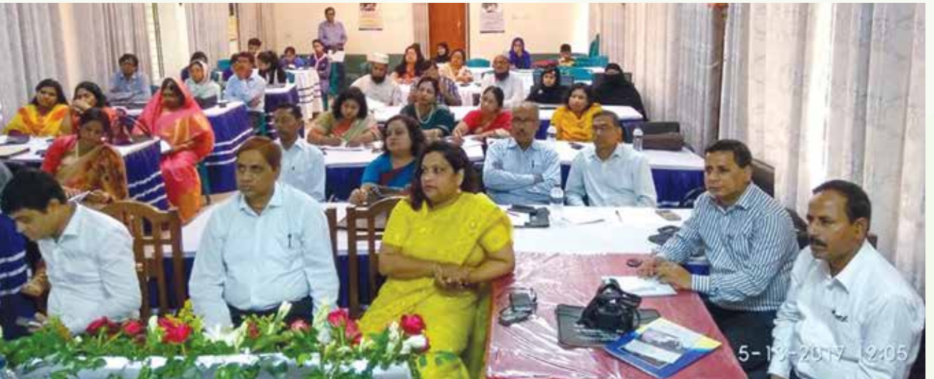
[ফরিদপুরে অনুষ্ঠিত 'নারী শিক্ষা অব্যাহত ও নারীকে আত্মপ্রত্যয়ী করে তোলার বিষয়ে করণীয়' শীর্ষক কর্মশালায় অংশগ্রহণকারীগণ।]