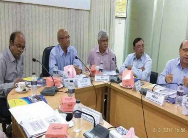
[বিগত ০৩ আগস্ট, ২০১৭ খ্রিস্টাব্দে প্রধানমন্ত্রীর শিক্ষা সহায়তা ট্রাস্ট এর ট্রাস্টি বোর্ড এর ৬ষ্ঠ সভা মাননীয় শিক্ষামন্ত্রী জনাব নুরুল ইসলাম নাহিদ এম.পি'র সভাপতিত্বে ট্রাস্ট এর সম্মেলন কক্ষে অনুষ্ঠিত হয়।]