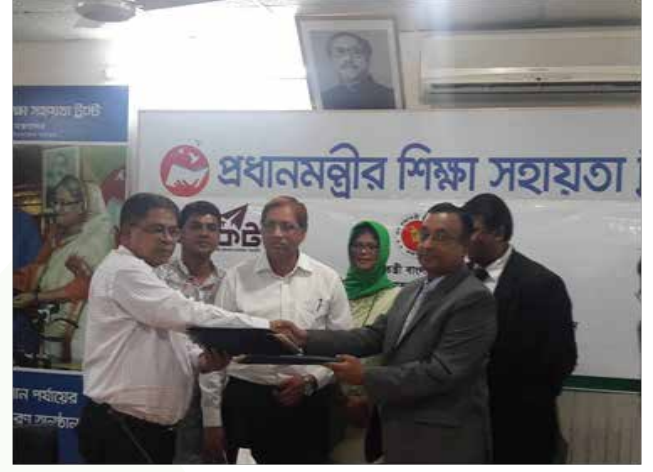
[স্নাতক (পাস) ও সমমান পর্যায়ের শিক্ষার্থীদের উপবৃত্তির অর্থ মোবাইল একাউন্ট 'রকেটে' এর মাধ্যমে পৌঁছানোর লক্ষ্যে ডাচবাংলা ব্যাংক লি. এর সাথে ট্রাস্ট এর চুক্তিপত্র স্বাক্ষরিত হয়।]