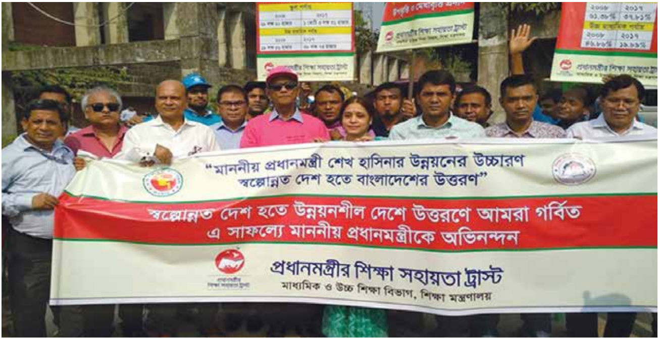
[বাংলাদেশ স্বল্পোন্নত দেশ হতে উন্নয়নশীল দেশে উন্নীত হওয়ায় মন্ত্রিপরিষদ বিভাগ আয়োজিত আনন্দ র্যালীতে প্রধানমন্ত্রীর শিক্ষা সহায়তা ট্রাস্ট এর পক্ষ থেকে অংশগ্রহণ]