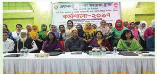
[নাটোরে অনুষ্ঠিত ‘নারী শিক্ষা অব্যাহত ও নারীকে আত্মপ্রত্যয়ী করে তোলার বিষয়ে করণীয়’ শীর্ষক কর্মশালার অংশগ্রহণকারী নারীদের একাংশ]