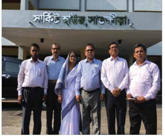
[‘নারী শিক্ষা অব্যাহত ও নারীকে আত্মপ্রত্যয়ী করে তোলার বিষয়ে করণীয়’ শীর্ষক কর্মশালা সাতক্ষীরা সার্কিট হাউজে অনুষ্ঠিত হয়]