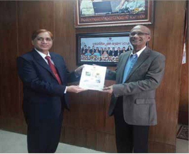
[মাননীয় শিক্ষামন্ত্রী জনাব নুরুল ইসলাম নাহিদ এম.পি'র হাতে ২০১৬-২০১৭ অর্থবছরের বার্ষিক প্রতিবেদন তুলে দিচ্ছেন প্রধানমন্ত্রীর শিক্ষা সহায়তা ট্রাস্ট এর ব্যবস্থাপনা পরিচালক।]