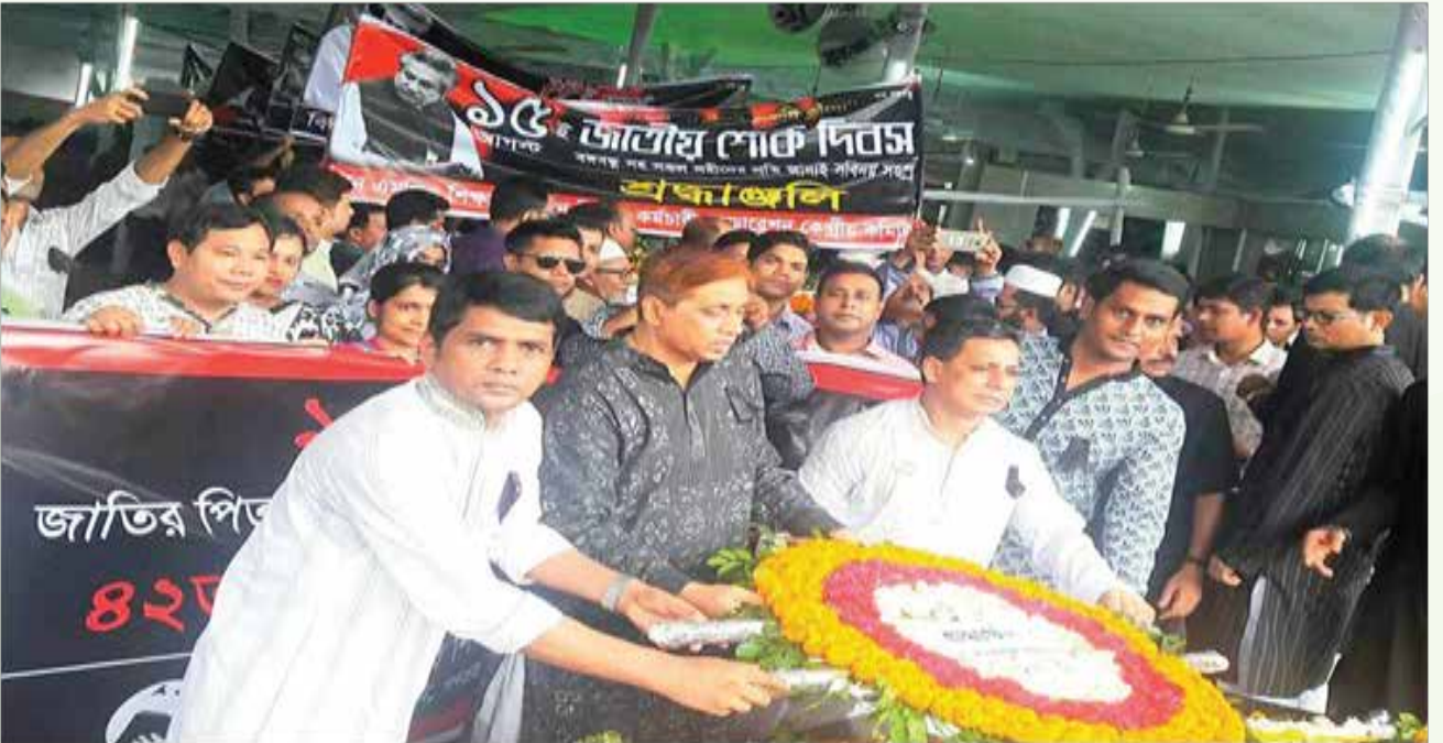
[জাতীয় শোক দিবস ও জাতির পিতা বঙ্গবন্ধু শেখ মুজিবুর রহমান এর ৪২ তম শাহাদাৎ বার্ষিকী উপলক্ষে ধানমন্ডি ৩২ নম্বর রোডস্থ বঙ্গবন্ধুর প্রতিকৃতিতে প্রধানমন্ত্রীর শিক্ষা সহায়তা ট্রাস্ট এর পক্ষ থেকে পুষ্পস্তবক অর্পণকরা হয়।]

জাতীয় শোক দিবস ও জাতির পিতা বঙ্গবন্ধু শেখ মুজিবুর রহমান এর ৪২ তম শাহাদাৎ বার্ষিকী উদযাপন উপলক্ষে ১৫ আগস্ট, ২০১৭ খ্রি. তারিখে প্রধানমন্ত্রীর শিক্ষা সহায়তা ট্রাস্ট কর্তৃক গৃহীত কর্মসূচি অনুযায়ী সকাল ৭.৩০ মিনিটে ধানমন্ডি ৩২ নম্বর রোডস্থ বঙ্গবন্ধু স্মৃতি যাদুঘরে জাতির পিতা বঙ্গবন্ধু শেখ মুজিবুর রহমান এর প্রতিকৃতিতে পুষ্পস্তবক অর্পণ করা হয়। সকাল ৯.৩০ মিনিটে প্রধানমন্ত্রীর শিক্ষা সহায়তা ট্রাস্ট এর সম্মেলন কক্ষে জাতির পিতা বঙ্গবন্ধু শেখ মুজিবুর রহমান এর জীবনাদর্শ ও রাজনৈতিক জীবন সম্পর্কে আলোচনা ও মিলাদ-মাহফিলের আয়োজন করা হয়।